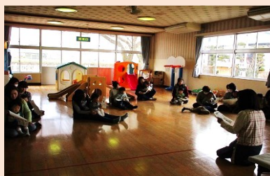
保健師による講話