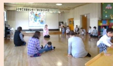
保健師による講話