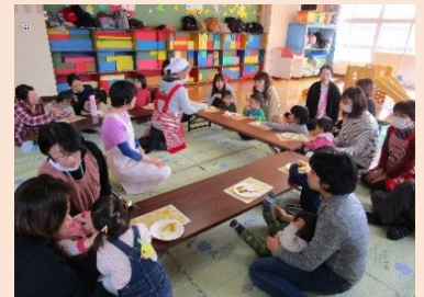
はっぴいエンゼル教室