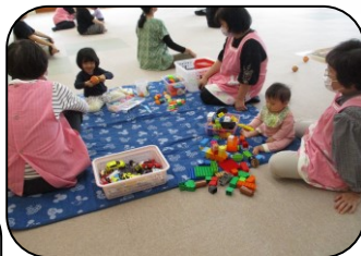
子どもを見てくださるので、ゆっくり集中してできました。