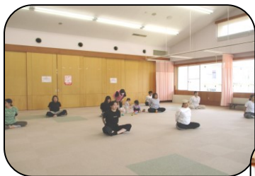
キツイかったけど気持ちがいい♡参加してよかった。

6月3日(月)「ママのヨガ教室①」を開催しました。 ビジターさんに託児を担当していただいたので、2か月のお子さん から3歳のお子さんまで 9組の親子に参加していただきました。