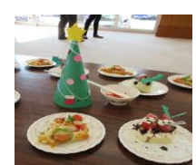
クッキングの様子 元年 12 月 16 日 実施