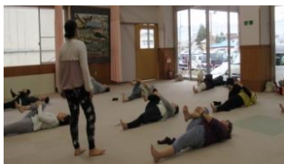
ヨガ教室の様子 元年 10 月 29 日 実施

令和 2 年度もママたちが楽しめる活動を考えております。その時は、多数のご参加をお待ちしております。